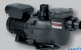
Max-Flo XL™ VSTD

Boîtier rotatif pour faciliter l'accès à l'interface dans les locaux exigus.