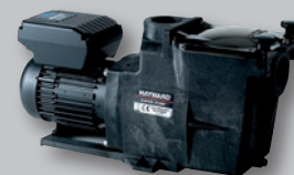
Super Pump® VSTD