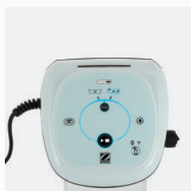
Boîtier de commande