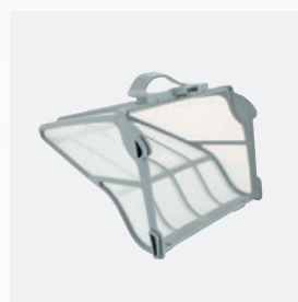
Bac filtrant Filtre très fin rigide de grande capacité (5 litres)